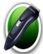
Namu qarsai tukas