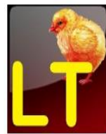
Gyvūnai (ūkis) Lithu tukas