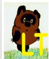
MIKE_LT_AK lithuan tukas