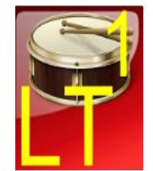
Muzikiniai instrume tukas