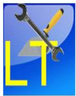
profesijos_LT_AK ke tukas