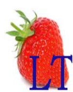
maistas LT - as nori tukas