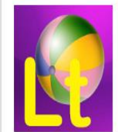
As noriu2 veikla :Lith tukas