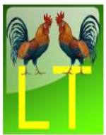
DU GAIDELIAI LT (ve tukas