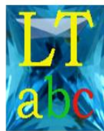
abecele LT iqarsinte tukas