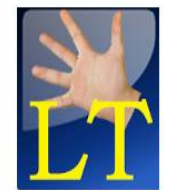
Kuno dalys tukas