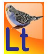
Pauksčiai LT Lithua tukas