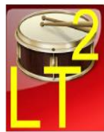
Muzikiniai instrume tukas